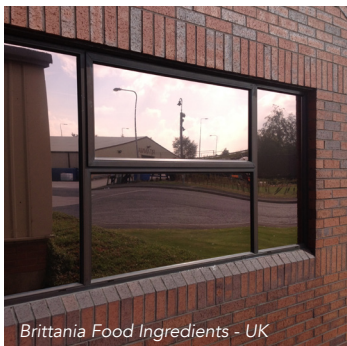
Brittania Food Ingredients - UK

La gamme Solar Gard® Sentinel™ Plus OSW de Solar Gard est constituée des films pour application extérieure de protection maximale contre la chaleur. Ils sont le premier rempart de défense contre les niveaux élevés de chaleur, de reflets et de rayons UV. La famille Solar Gard® Sentinel™ Plus OSW permet un contrôle solaire par l'extérieur qui optimise la luminosité naturelle tout en contrôlant la chaleur solaire. Le rejet des ultra-violets protège les biens et les personnes contre le rayonnement UV.