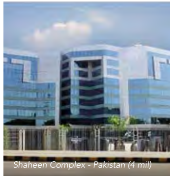
Shaheen Complex - Pakistan (4 mil)

☐ AC 4 mil Clear ☒ AC 7 mil Clear ☐ AC 8 mil Clear