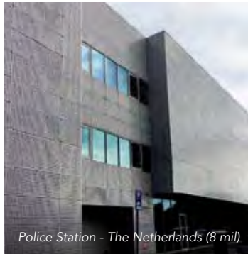
Police Station - The Netherlands (8 mil)

Armorcoat® est non réfléchif et donc virtuellement invisible sur vos fenêtres, jour et nuit. Les couches de polyester hautement résistantes, les adhésifs extrêmement performants offrent une atténuation considérable des effets de l'éclatement et une très grande capacité de résistance aux impacts.