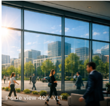
Inside view 40% VLT

Comme pour tous les produits Sentinel, le QXN 40 bloque plus de 99 % du rayonnement UV.