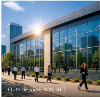
Outside view 40% VLT